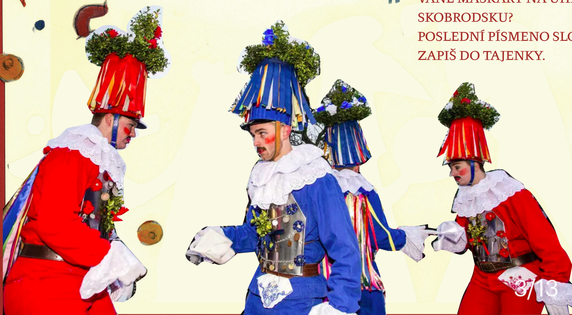
Masopust v Hamrech u Hlinska, Tanec Turků, 2018

JAK SE JMENUJE TANEC, KTERÝ TANČÍ UNIFORMO- VANÉ MAŠKARY NA UHER- SKOBRODSKU? POSLEDNÍ PÍSMENO SLOVA ZAPIŠ DO TAJENKY.